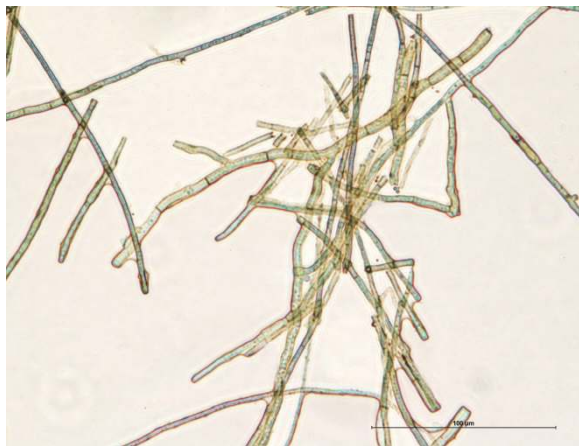
图 4 病原菌菌丝特征 (×40)