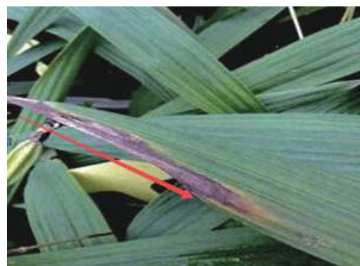
图 2 温室白及接种发病症状图

Fig. 1 Symptoms of D. concentrica on B. striata from Funing