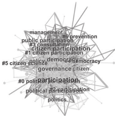
图3 WoS数据库中公民参与关键词聚类图

CNKI中,关键词共分为13类,#0类包含新公共服务、参与式预算、网络治理等57个关键字,该类文章主要研究的是公民参与各项公共事务,如公共预算、基层自治、城市规划等;#1主要包括公民社会、社交媒体、社会信任等36个关键词,该类论文主要探讨市民利用网络在公共管理领域发挥的舆论作用,如乡村治理、新农村建设,应急管理;#2类主要包括公共服务、服务型政府、开放政府等35个关键词,该类文章主要探讨在服务型政府中公民与政府之间的关系以及政府为公民参与提供的路径;#3类主要包括公共政策、协商民主、善治等34个关键词,主要研究公民参与公共决策;#4类包括政治参与、民主政治、网络反腐等33个关键词,主要研究公民对政